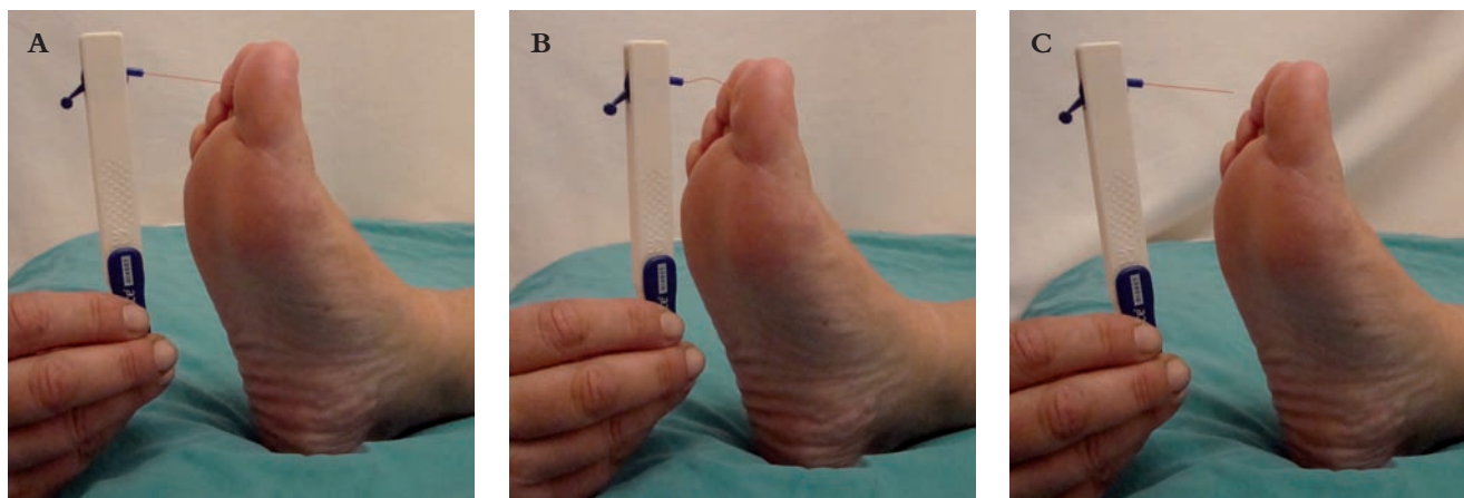
Figura 1: Técnica del monofilamento. A) Aproximación y contacto con la superficie cutánea. B) Monofilamento combado, que ejerce presión durante 1-2 s. C) retirada del monofilamento de la piel.

Grupo de trabajo de la Guía de Práctica Clínica sobre Diabetes tipo 2. Guía de Práctica Clínica sobre Diabetes tipo 2. Madrid: Plan Nacional para el SNS del MSC. Agencia de Evaluación de Tecnologías Sanitarias del País Vasco; 2008. Guías de Práctica Clínica en el SNS: OSTEBA N.º 2006/08.